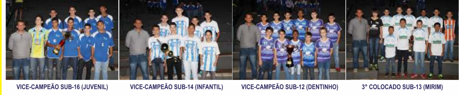
VICE-CAMPEÃO SUB-16 (JUVENIL) VICE-CAMPEÃO SUB-14 (INFANTIL) VICE-CAMPEÃO SUB-12 (DENTINHO) 3º COLOCADO SUB-13 (MIRIM)